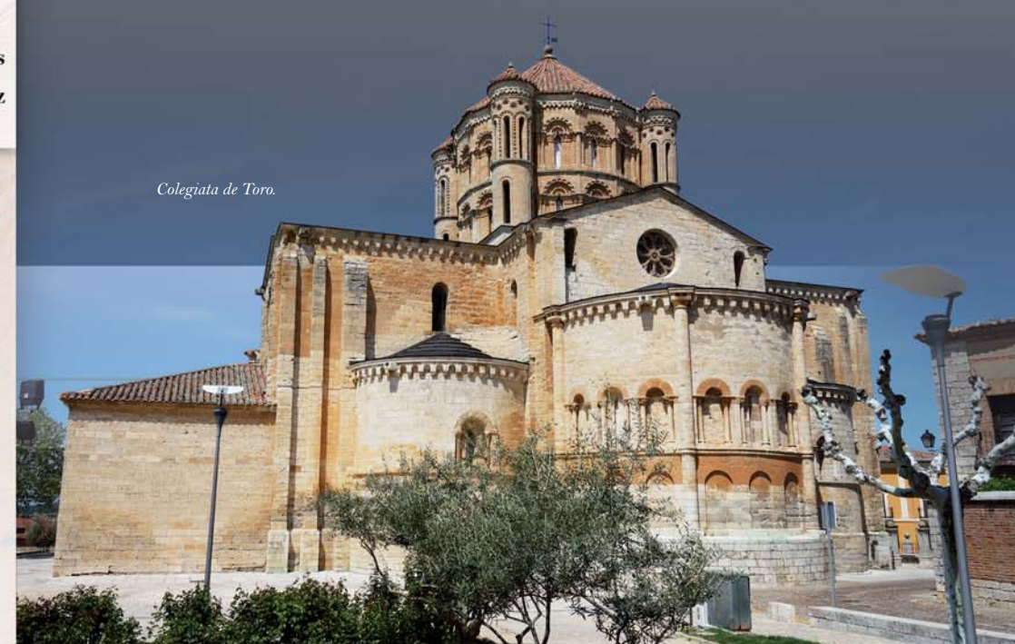
Colegiata de Toro.