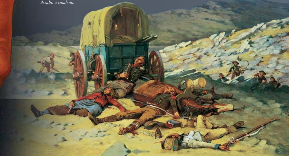
Assalto a comboio.