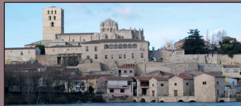
Panorâmica de Zamora.

Começa a leste em Roa, emblemática povoação onde o "el Empecinado" foi justicado anos depois da guerra por ordem de Fernando VII. Castrillo foi onde nasceu, Valladolid e as povoações próximas onde executou as suas primeiras ações como guerrilheiro, o Manco de Tordesilhas era um dos seus ajudantes principais.