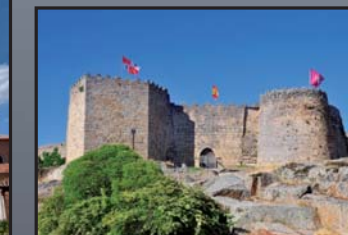
Castelo de Ledesma.