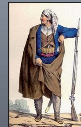
Guerrilheiros do grupo do "el Empecinado".

Os Guerrilheiros tiveram diversas origens e trajetórias. Uns tinham sido soldados antes da guerra, outros nunca tinham saído do âmbito civil. Uns enquadraram-se desde o primeiro momento no organigrama militar, outros só o farão com o tempo e, alguns, resistirão à autoridade para serem absorvidos ou dissolvidos. Todos eles partilharam o seu desafio constante ao domínio galês, a sua capacidade de adaptação, a insegurança e ansiedade que criavam no soldado inimigo e uma popularidade que se acentuou com o tempo a ponto de entrarem na lenda como os grandes artífices da derrota do Imperador.