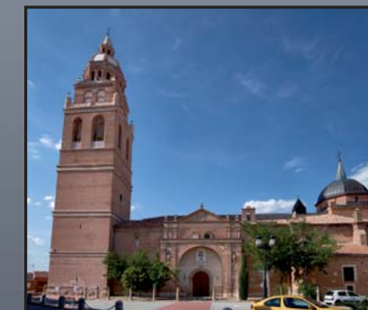
Igreja de Santa María em Alaejos.

Prestar homenagem no túmulo do Charro em Ciudad Rodrigo, hospedar-se no seu Parador e visitar a exposição do Palácio de los Águila sobre a Guerra da Independência. Conhecer, nas proximidades, a Zona Arqueológica de Siega Verde ou o castelo de San Felices de los Gallegos. Passear pelo campo de batalha de Los Arapiles e descobrir a sua Aula de Interpretação com o Primer Edecán. Desfrutar das vistas do alto do Torreão de Alba de Tormes. Regalar o paladar na Rota do Vinho de Cigales, da Ribera del Duero, de Toro e de Rueda. Passar a noite no Hotel Jardín de la Abadía em Arroyo de la Encomienda, junto a Valladolid.