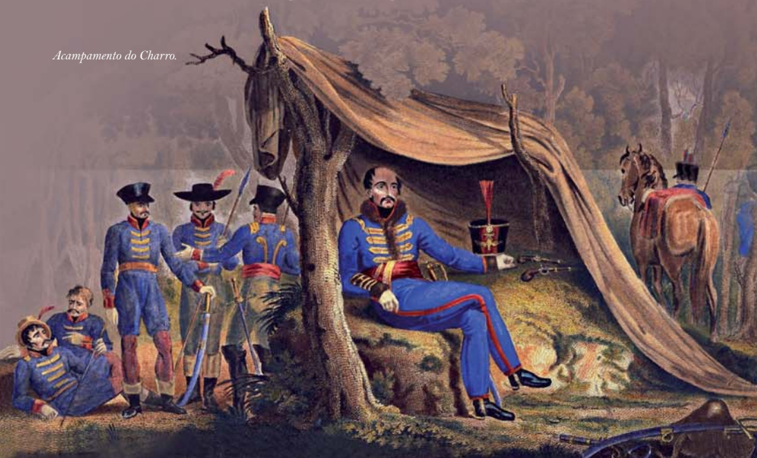
Acampamento do Charro.

Ambos terminaram a guerra como generais do Exército espanhol.